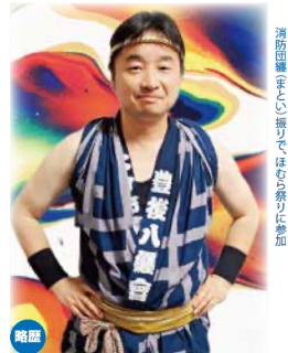
略歴 ●1975年福岡県岡垣町生まれ。別府大学文学部卒。 ●1998年大分健生病院に入職。労働組合書記長や大分県労働副議長などをつとめる。 ●大分市議1期。 ●家族は、妻・子ども2人。趣味はバイク、生け花、合奏。